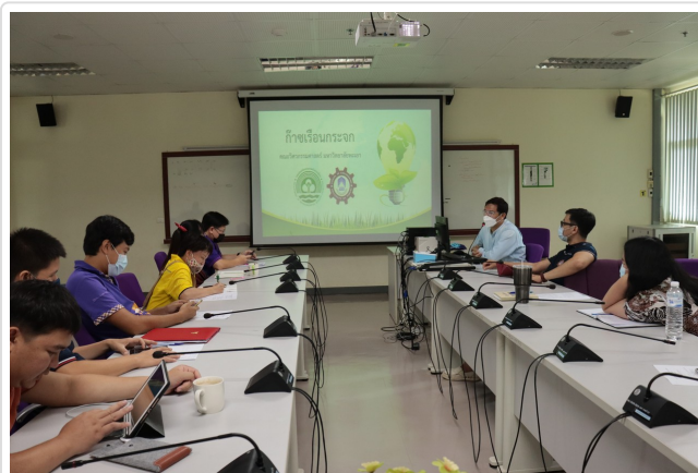
( http://www.eng.up.ac.th/images/news/IMG_5827.jpg )