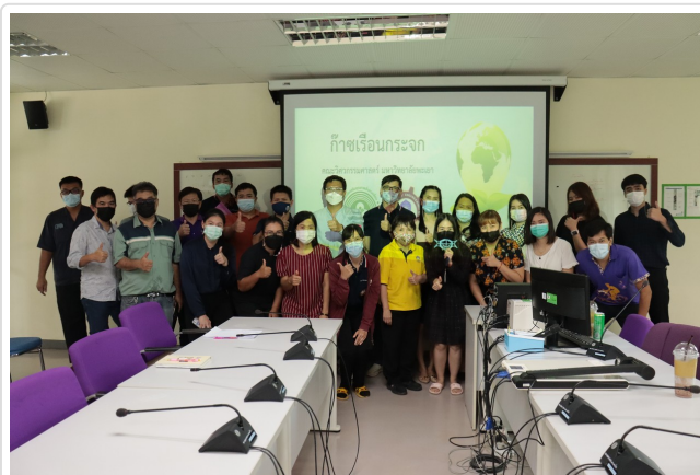
( http://www.eng.up.ac.th/images/news/IMG_5844.jpg )