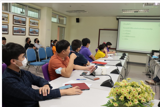
( http://www.eng.up.ac.th/images/news/IMG_5823.jpg )