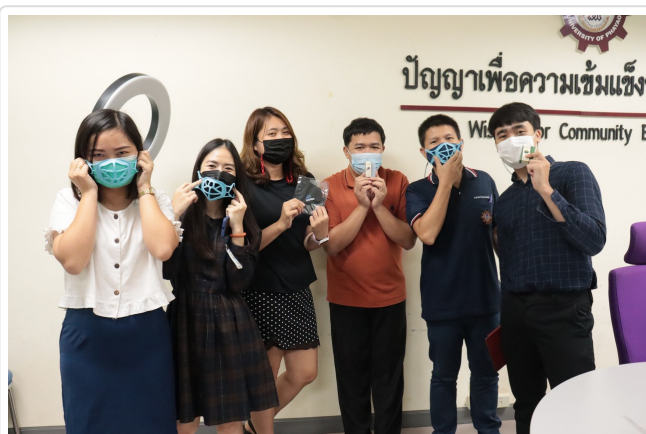
( http://www.eng.up.ac.th/images/news/IMG_5846.jpg )