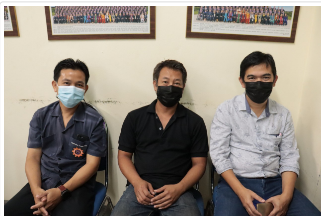
( http://www.eng.up.ac.th/images/news/IMG_5819.jpg )